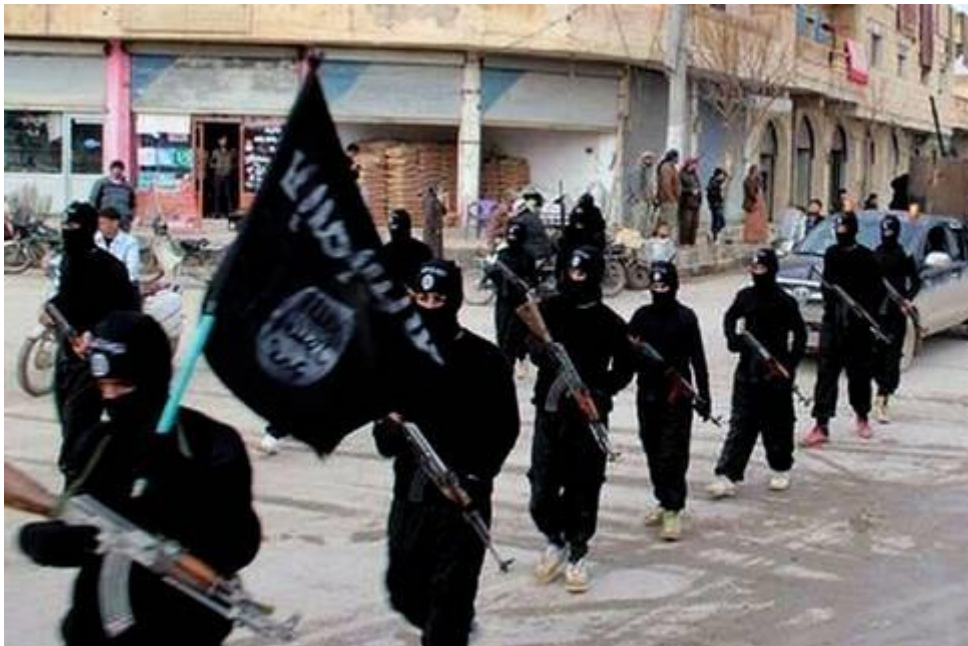
Soldater från al-Qaida-länkade terrororganisationen Isis.

Isis terror i Mellanöstern är förstås det värsta. Stora delar av Syrien och Irak drabbas. Men även för svenskt vidkommande har Isis en våldspotential som är skrämmande hög.